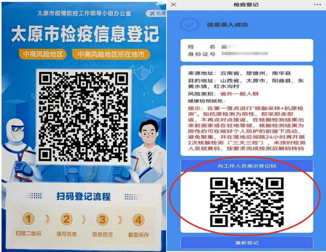
附图2 太原市检疫登记信息系统小程序操作说明