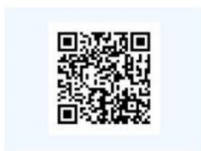
（图1 来报备系统二维码）

步骤 1：用微信或者支付宝扫描二维码（见图 1），进入来（返）宁人员信息申报界面；也可以搜索微信（支付宝）小程序“南京的我”（见图 2、图 3）点击进入，然后点击红色方框标识的“疫情防控专题”（见图 4）进入防疫专题服务界面，点击黄色方框标识的“来（返）宁人员信息申报”（见图 5）